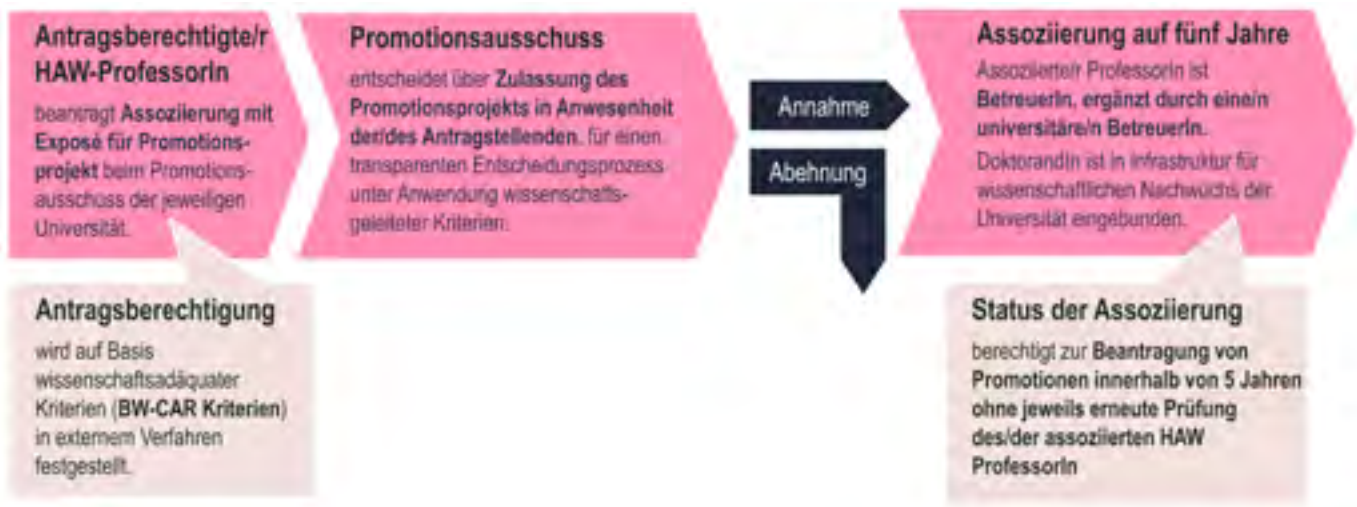
Abbildung 2: Modell der Assoziierung gemäß dem Vorschlag der Landesrektorenkonferenz in Baden-Württemberg 2016